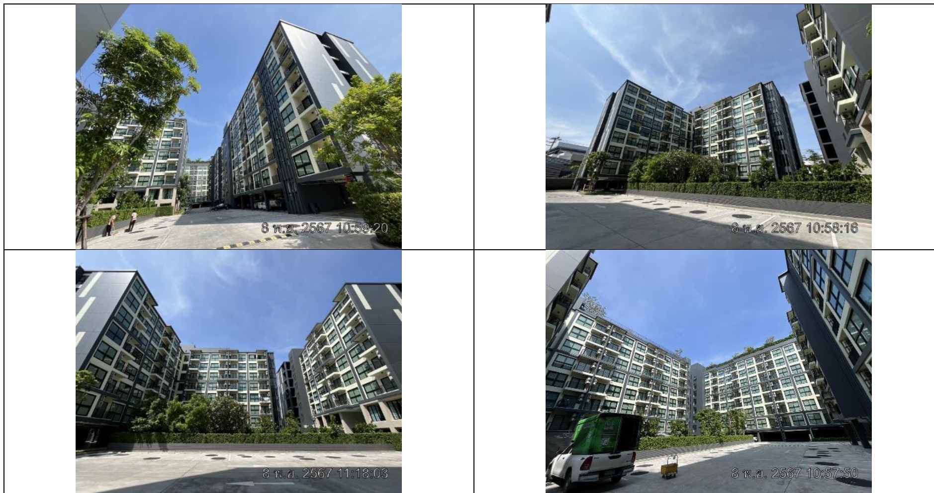
รูปที่ 1.3 สภาพโครงการในปัจจุบัน